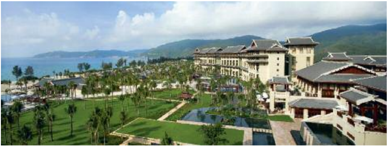
Das Ritz-Carlton Sanya auf der chinesischen Tropeninsel Hainan – einer der Neuzugänge im Portfolio von Marriott International. Das Unternehmen konnte sich mit knapp 3200 Häusern auf Platz drei der Branchengiganten behaupten

das Portfolio im Jahr 2012 auf über 100 Häuser steigen. Maritim schloss das Jahr 2008 mit 49 Hotels bzw. 14 500 Zimmern ab und behauptete sich damit auf Platz 57. Das seit Ende 2007 konstante Portfolio mit 37 Hotels im Inland und zwölf im Ausland soll noch diesen Herbst um das Maritim Hotel U-Town in Peking ergänzt werden; ein weiteres Haus in China ist für 2010 geplant.