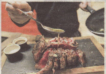
Am Ende mit Meersalz würzen und Butter dazugeben