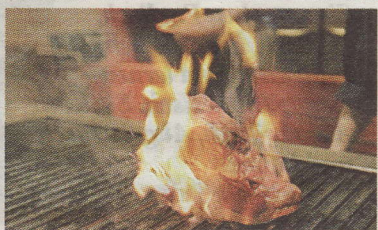
Zuerst kurz anbraten, damit sich die Poren schließen

1 Dann geht's ans Braten: Das Steak sollte man schon vor dem Braten aus dem Kühlschrank holen, damit es nicht innen noch kalt ist und außen verbrannt. Grill-Koch Urim legt das rund vier Finger dicke Steak auf den Lavastein-Grill. „Mit Gas werden die Steine erhitzt. Das edle Fleisch soll sich